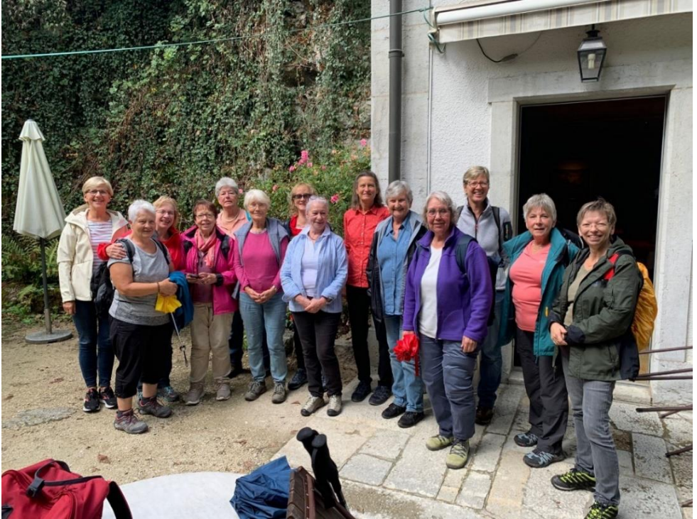
Erste zaghafte Sonnenstrahlen beim Verlassen des Restaurants.

Danach servierte das freundliche Personal einen köstlichen Salat gefolgt von Rahmschnitzel mit Nüdeli und Früchtégarnitur. Die Weinliebhaber gönnten sich dazu einen fruchtigen Roten aus dem Piemont.