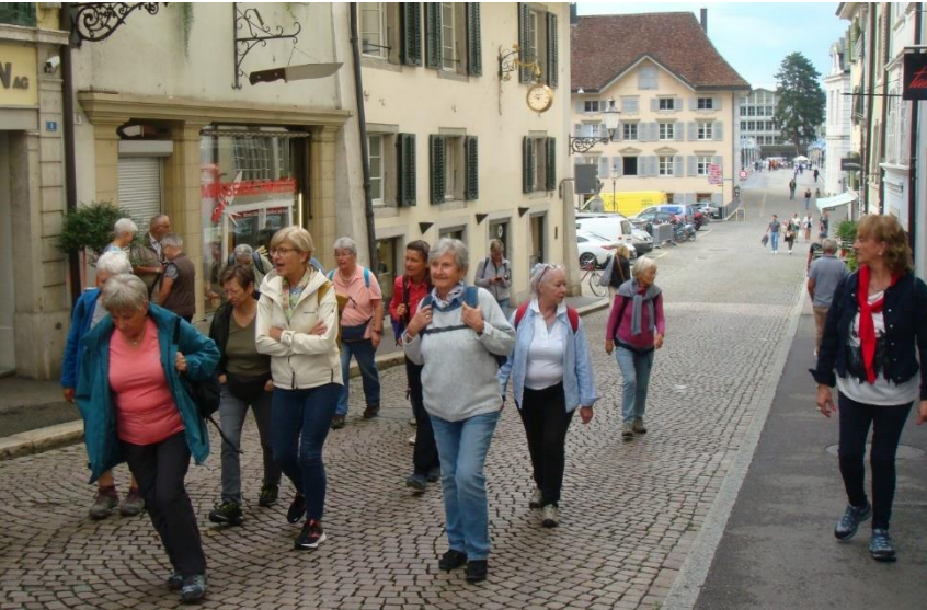
Nur noch ein paar Schritte bis zum Kafi.

drein machte ein Gruss aus der Coniserieabteilung in Form eines Tellers mit assortierten Pralinés vom Feinsten die Runde. Als die ersten Regentropfen auf das Glasdach des Gebäudes prasselten, schwante uns, dass Petrus wohl kein Passivmitglied des dtvo ist.